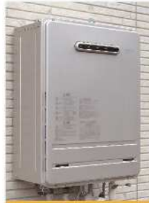
給湯器/エコキュート